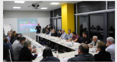
Salle de réunion – 70 m 2 / 40 places Grand Ecran, Vidéoprojecteur, Paper Board

Toutes les informations sur nos solutions entreprises sur le site bowlingdesaintlo.fr/entreprises