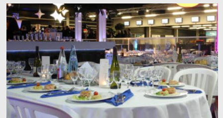
Restauration personnalisée Formules traiteur à la carte